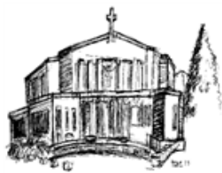
Parrocchia Cristo Risorto

Aperta ogni domenica dalle 19:00 (anche per asporto) Prenotazioni: 049 611.398