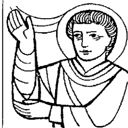
SANTO STEFANO primo martire