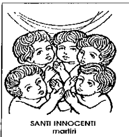
SANTI INNOCENTI martiri