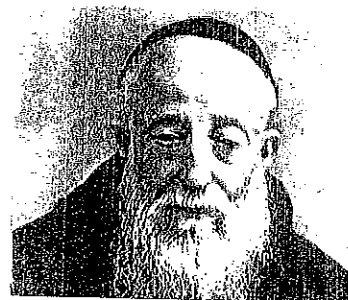
san Leopoldo Mandic