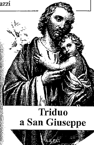
Triduo a San Giuseppe