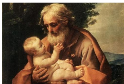
Guido Reni. S. Giuseppe e il Bambino