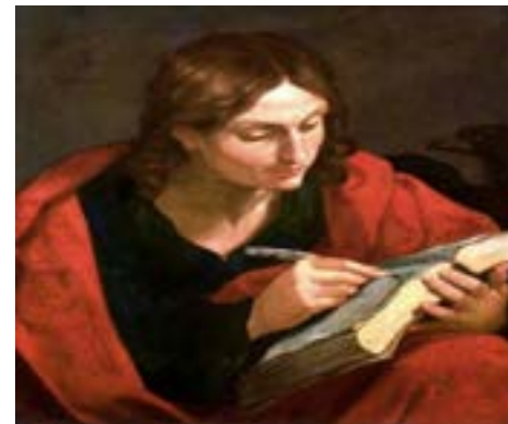
Guido Reni, San Giovanni evangelista e l'aquila (1620-1621), olio su tela; Greenville (USA)

In principio era il Verbo, e il Verbo era presso Dio e il Verbo era Dio. Egli era in principio presso Dio: tutto è stato fatto per mezzo di lui, e senza di lui niente è stato fatto di tutto ciò che esiste. In lui era la vita e la vita era la luce degli uomini; la luce splende nelle tenebre, ma le tenebre non l'hanno accolta. Veniva nel mondo la luce vera, quella che illumina ogni uomo. Egli era nel mondo, e il mondo fu fatto per mezzo di lui, eppure il mondo non lo riconobbe. Venne fra la sua gente, ma i suoi non l'hanno accolto. A quanti però l'hanno accolto, ha dato potere di diventare figli di Dio: a quelli che credono nel suo nome, i quali non da sangue, né da volere di carne, né da volere di uomo, ma da Dio sono stati generati. E il Verbo si fece carne e venne ad abitare in mezzo a noi; e noi vedemmo la sua gloria, gloria come di unigenito dal Padre, pieno di grazia e di verità.