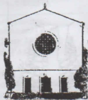
S. LAZZARO in Padova

Geremia 31,7-9 Dio è un Padre per Israele Ebrei 5,1-6 Gesù, sommo sacerdote Marco 10,46-52 Gesù ridona la vista a Bartimeo