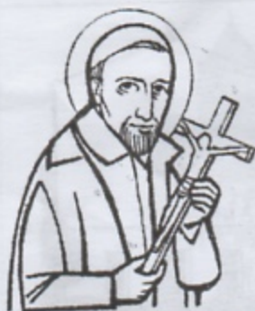
SAN VINCENZO DE' PAOLI sacerdote