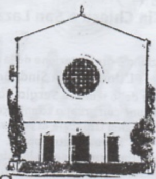
S. LAZZARO in Padova

Isaia 50,5-9a Il Servo del Signore S. Giacomo 2,14-18 La fede senza le opere, è morta Marco 8,27-35 E voi, chi dite che io sia?