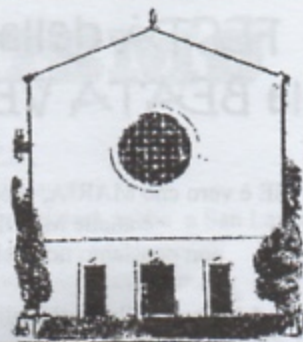
S. LAZZARO in Padova

Deuteronomio 4,1-2.6-8 Le leggi di Mosè hanno origine in Dio S. Giacomo 1,17-27 Non basta ascoltare la Parola Marco 7,1-8.14-15 Dio non giudica l'esterno