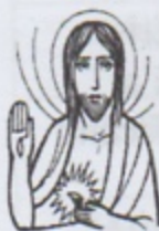
SACRATISSIMO CUORE DI GESU'

09.00 Santa Messa e preghiera al Cuore di Gesù