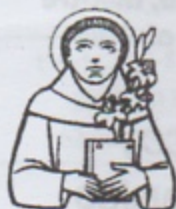
SANT'ANTONIO DI PADOVA sacerdote e dottore della Chiesa

Ricordiamo le proposte per la festa del SANTO