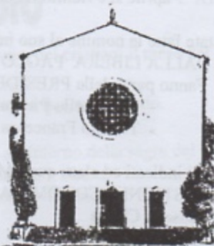
S. LAZZARO in Padova

Atti 3,13-19 Il discorso di Pietro dopo la Pentecoste 1Giovanni 2,1-5 Cristo, vittima di espiazione per i peccati Luca 24,35-48 Altra apparizione di Cristo Risorto