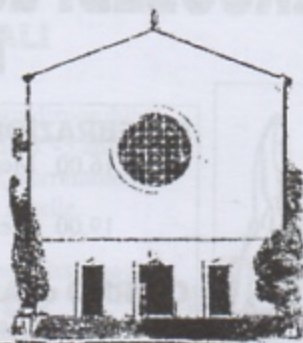
S. LAZZARO in Padova

Levitico 13,1-2.45-46 Una lebbra non solo del corpo 1Corinzi 10,31-11.1 Tutto deve essere fatto per la gloria di Dio Marco 1,40-45 Gesù ci guarisce da ogni lebbra