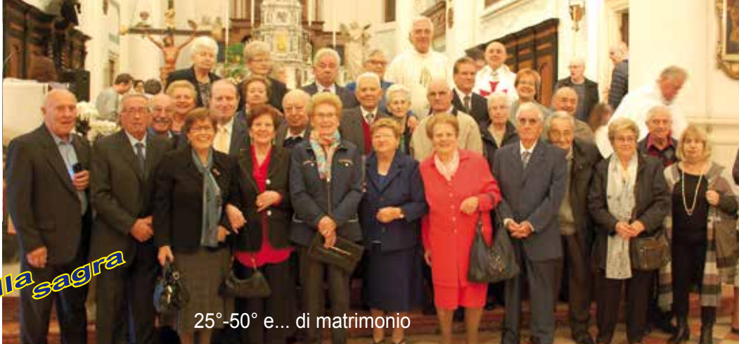
foto flash dalla sagra