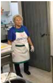
25°-50° e... di matrimonio