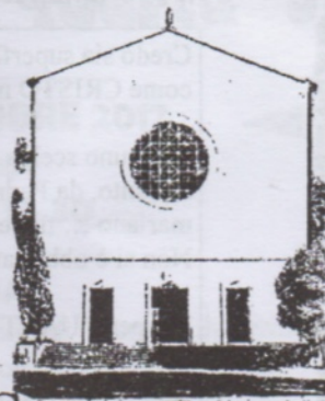
S. LAZZARO in Padova

Isaia 61,1-2a.10-11 Lo Spirito del Signore è su di LUI !Tewssalonesi 5,16,24 Fratelli, siate sempre lieti Giovanni 1,6-8.19-28 la testimonianza di Giovanni