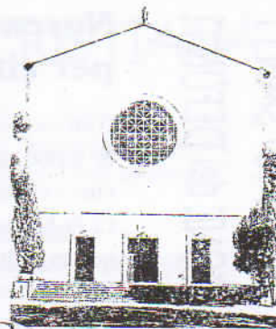
S. LAZZARO in Padova

Esodo 22,20-26I doveri verso il prossimo più bisognoso I Tessalonicesi 1,5c-10 La testimonianza di carità dei Tessalo. Matteo 22,34-40 Il comandamento più grande