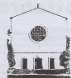
S. LAZZARO in Padova

Isaia 5,1-7 L'amore di Dio per la sua vigna Filippesi 4,6-9 Nulla può distruggere la pace e la gioia Matteo 21,33-43 La storia della vigna del Signore