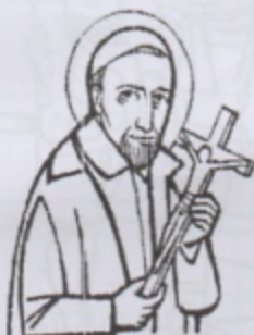
SAN VINCENZO DE' PAOLI sacerdote