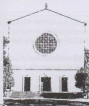
S. LAZZARO in Padova

Isaia 55,6-9 Cercate il Signore, mentre si fa trovare Filippesi 1,20c-27a Per me il vivere è Cristo Matteo 20, 1-16a I lavoratori della vigna