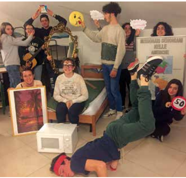
Giovani di Torre impegnati durante le "10.000 ore di solidarietà".