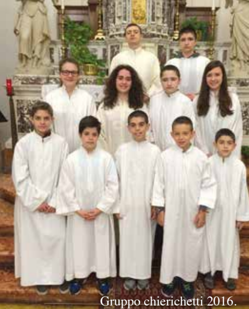
Gruppo chierichetti 2016.