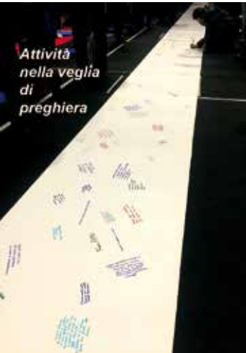
Attività nella veglia di preghiera

Preparatoria - formata da 36 membri rappresentanti delle varie zone della Diocesi, dei movimenti e delle associazioni (in primis, Azione Cattolica e Scout) e di alcune realtà significative (il mondo della Scuola, della Caritas, delle Missioni, dei Religiosi) - sta elaborando le tracce di confronto che verranno inviate via mail ai gruppi sinodali che lavoreranno dopo l'estate.