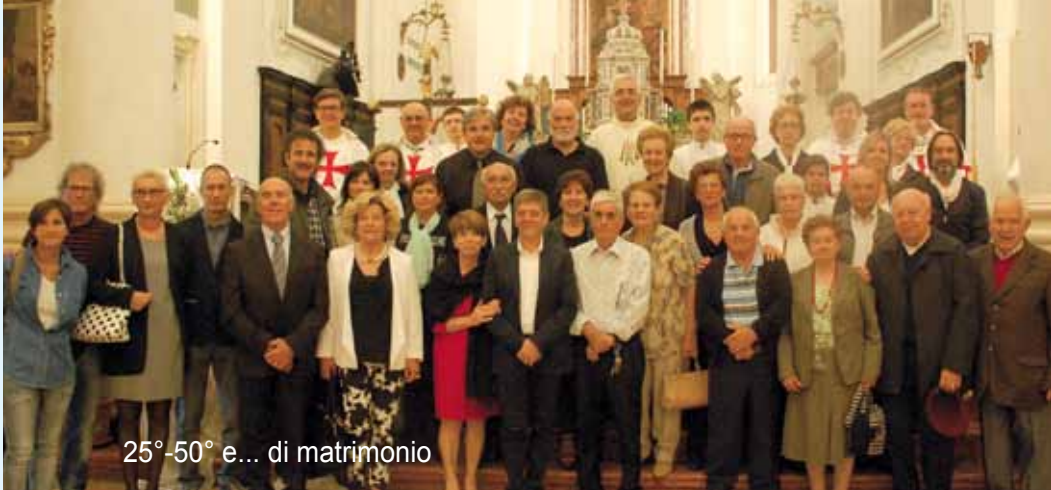
25°-50° e... di matrimonio